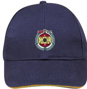
Gorra bordada con logotipo, en marino y beige 10 €