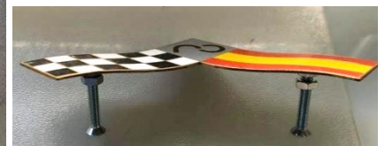
Insignias Circuito del Jarama con tornillo o planas 20 €

PEDIDO MÍNIMO 20 € [+5 € gastos de envío]