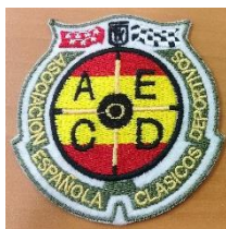
Galleta adhesiva bordada 5 €