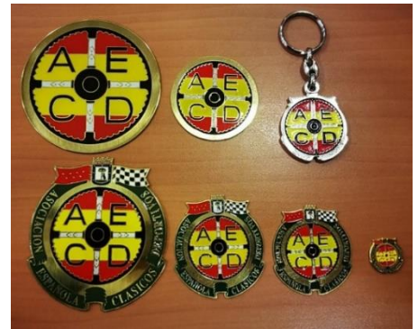
Insignias grandes en latón esmaltado 20 € Pins dorados pintados 3 €