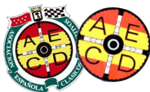
Adhesivos interior/externo 2 €