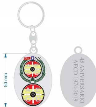
Llavero con logotipo o con logotipos de la AECD Cultural y Deportiva e inscripción 45 Aniversario 5 €