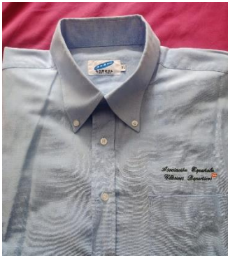
Camisa Oxford manga larga bordada con texto y bandera 25 €

Ponemos a disposición de todos nuestros socios y seguidores un amplio catálogo de productos personalizados de la AECD